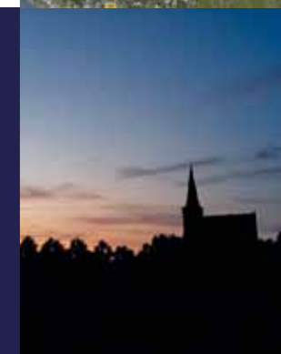
't Woudt, Westland