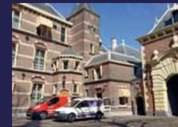
Het Binnenhof, Den Haag